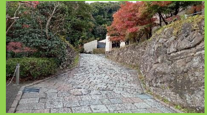
【鎌倉歴史交流館入口付近】

※R4 地区会計報告 ○収入 ①R4/9/20 活動支援金(寄付)¥2000 ②R4/11/26 参加費(800×5) ¥4000 計 ¥6000 ○支出 ①R4/11/2 鎌湘地区広報経費 ¥1680 ②R4/11/26 鎌倉ガイド協会 ¥3000 計 ¥4680 ●残額 ¥6000-¥4680=¥1320 …次回地区会活動費等に充当予定です。(平田)