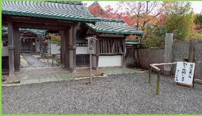
【牡丹園と休園中看板】